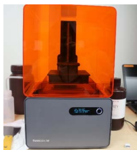
form+1 : 3D printer