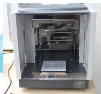
METAZA : metal printer