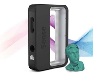
Sense : 3D scanner